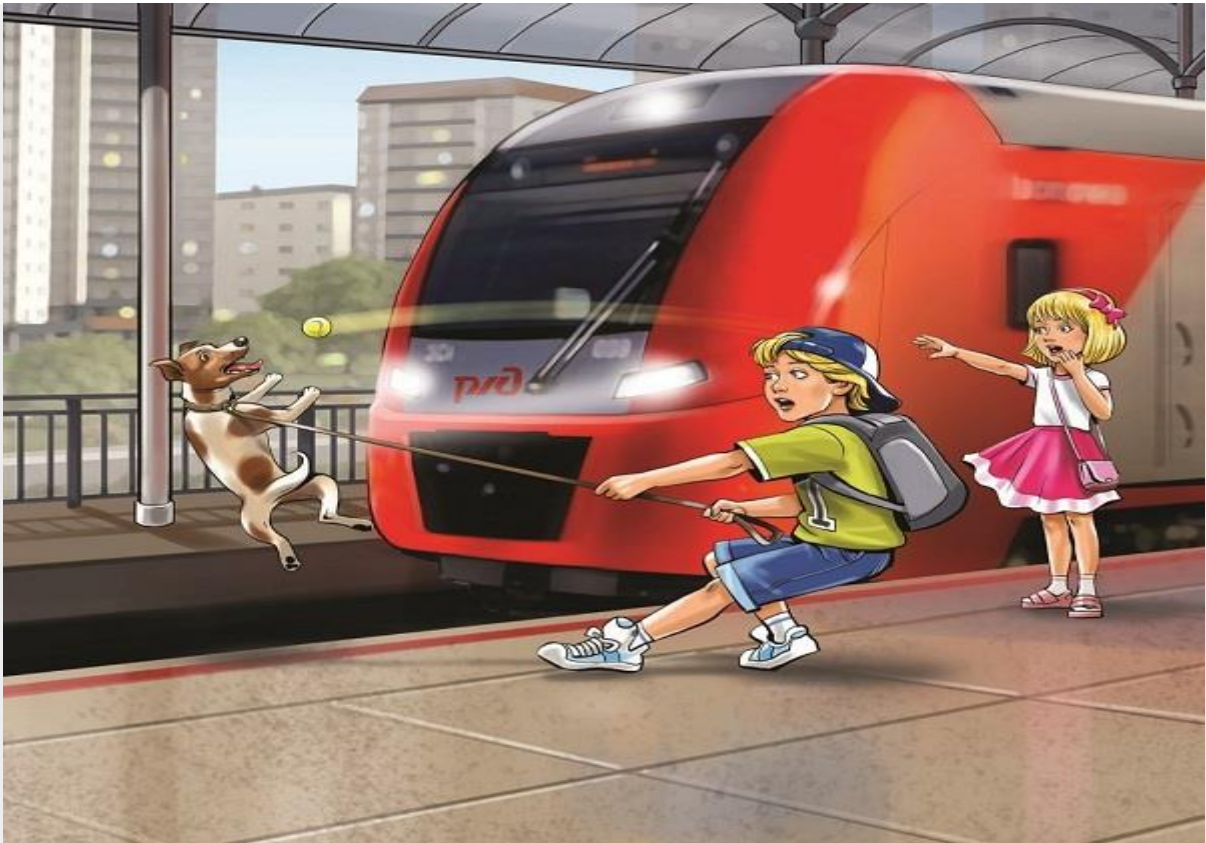
Третья часть от общего числа пострадавших на железной дороге - дети и подростки